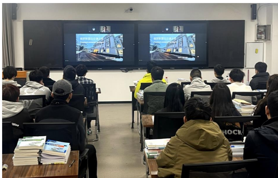
图 7 留学学生线上直播介绍留学生活

学校作为中外合作院校，在建设之初就为学生的对外交流搭建了完善的平台。学校以实施全日制专科教育为主，实行学分制和弹性学制，建立和健全学分制学籍管理规定。学生在中国期间学制为三年专科层次，可继续进入到外方升入本科教育。按国家和河南省教育行政部门的有关规定，学生修满规定学分，颁发国家承认的郑州亚欧交通职业学院毕业证书和外方合作高校相应专业的高等教育学历证明。毕业生实行双向选择、自主择业的就业方式，学校为毕业生提供就业指导和服务。同时，在符合国家规定前提下，按照外方的招生标准和培养方案，逐步探索开展本科生、研究生教育。