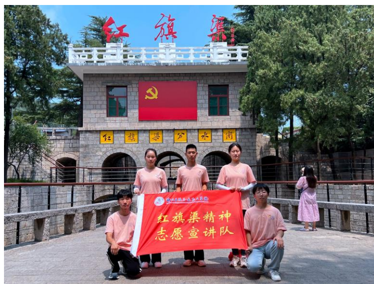
图 4 开展红旗渠精神宣讲活动，寻访“红旗渠精神”