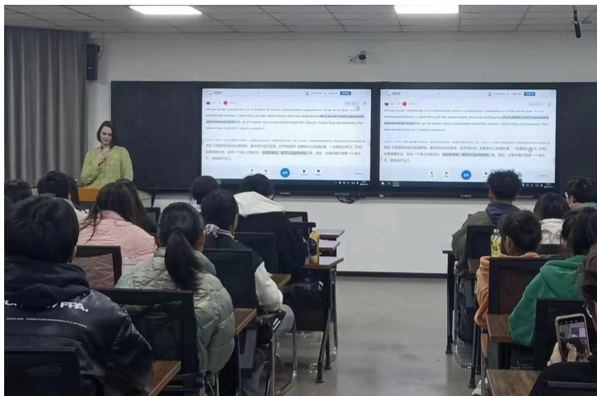
图 6 俄方外教给学生讲授专业课

2023年，俄方派遣俄籍语言教师4人、专业课教师3人，线下开设机械设计基础、钢轨打磨设备与应用、机械制图、跨境电子商务等课程4门，采用在线直播和录播方式开设电气控制与PLC应用、电力机车总体与走行部、电子技术、高电压技术、钢轨探伤、市场营销等课程11门，外方课程开课比例提升6%。学校在教室安装部署同步翻译软件，保障教学效果，顺利完成各项外方课教学任务。