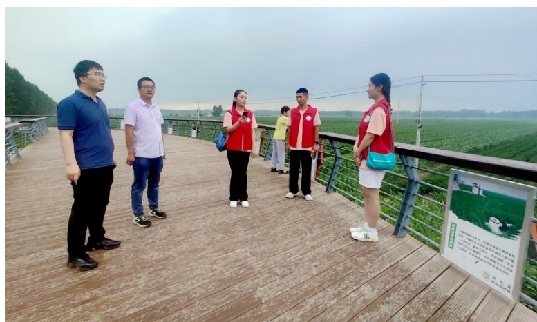
图 5 紧跟总书记足迹，参观尉氏县张市镇高标准示范农田

学校紧跟习近平总书记的脚步，组织师生参观位于尉氏县张市镇的高标准示范农田。通过实地参观培养学生对农民的感情，让他们和农民的心贴的更近，真切感受耕耘的艰辛和收获的喜悦，真正树立为“三农”服务的意识，更好的为社会主义新农村建设贡献自我力量。