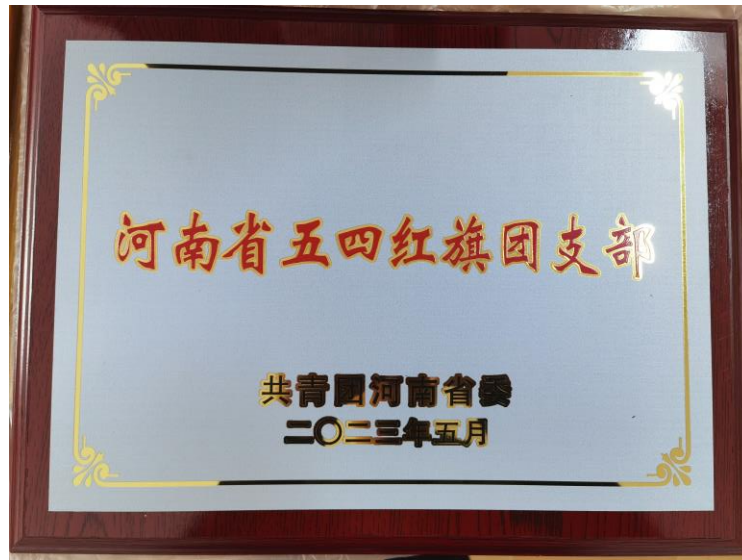
图 1 铁道机车 2002 团支部荣获河南省五四红旗团支部

堂中提升自我。组建学生宣讲小分队，组织学生学习贯彻党的二十大精神，先后进行校内宣讲 6 次。铁道机车 2002 团支部荣获河南省红旗团支部。